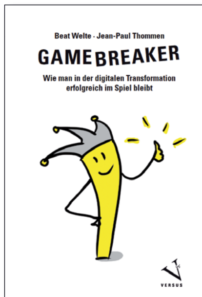
Illustration Achim Schmidt

Der Illustrator Achim Schmidt ist Coach für Design Thinking und Agile Innovation sowie Graphic Recorder (Live-Zeichner). Er hilft Firmen bei der Gestaltung neuer, disruptiver Geschäftsmodelle und ist Co-Autor mehrerer Bücher.