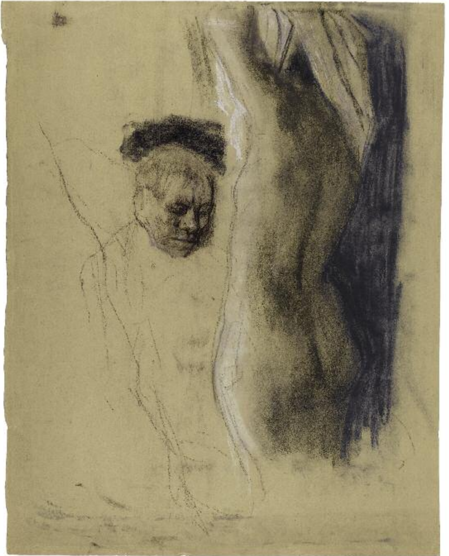
Käthe Kollwitz, Kniender Mann vor weiblichem Akt , nicht vor 1901 Kohle, blaue Kreide, weiß gehöht.